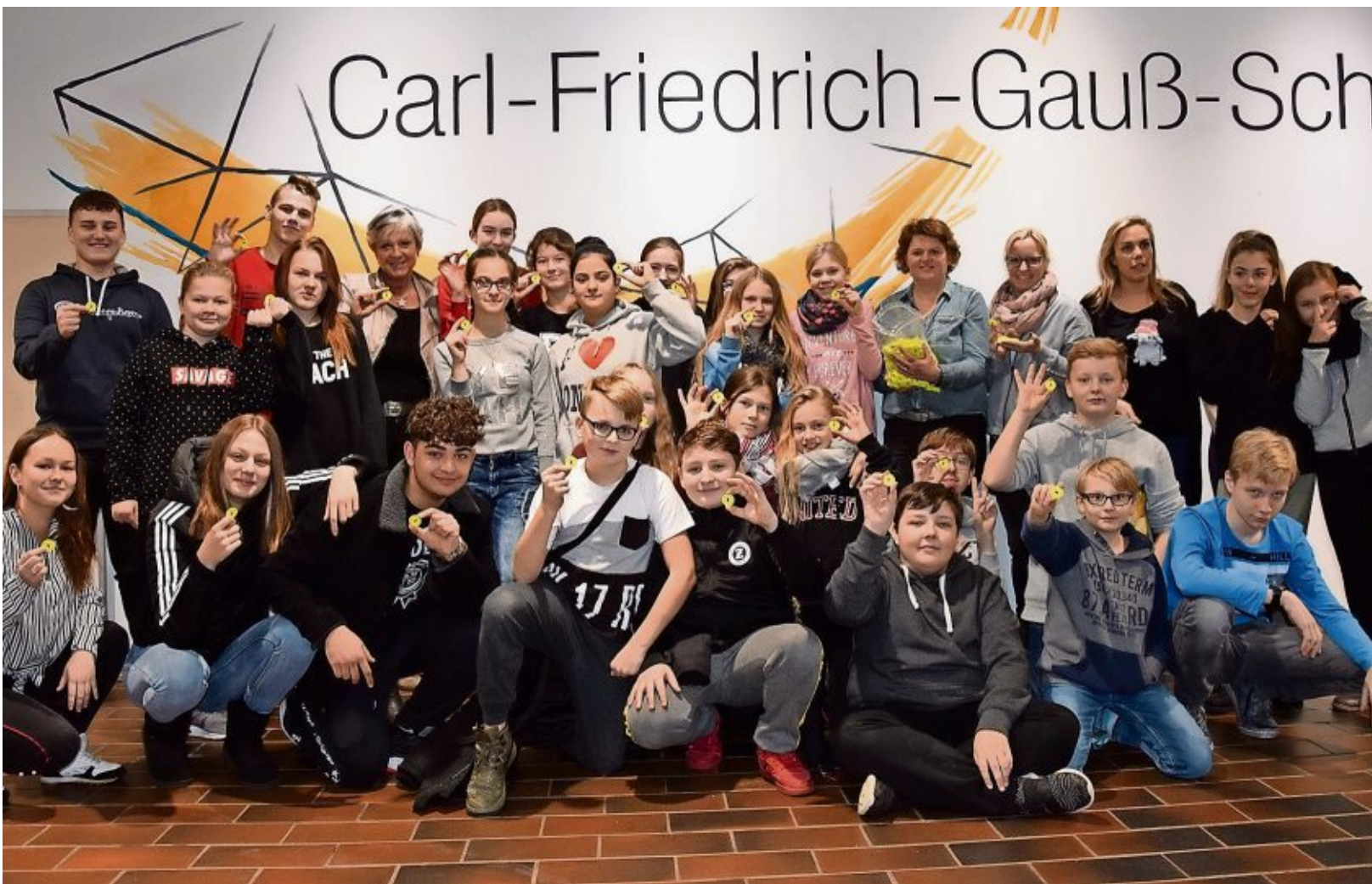
Die Schüler von Gesamt- und Oberschule an der Kanalstraße freuen sich schon auf den Tag der Weihnacht. Die gültige Währung am Freitag ist übrigens der Gauß-Taler, er ist 50 Cent wert und kann in zwei Wechselstuben getauscht werden.